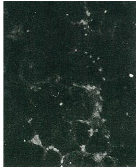
図2 HCV NS5b タンパク質の免疫蛍光染色

チンパンジー肝細胞に HCV ゲノム cDNA を含む組み換えワクチニアウィルスを感染させ、この抗体を用いてウエスタンブロットティングしたもの。58-kDa のバンドが検出された。