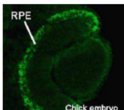
図 3. ステージ 14 のニワトリ胚の免疫組織染色。

パラホルムアルデヒドで胚を固定し OCT で包埋し、凍結切片を作成した。Mitif は RPE(Retinal Pigment Epithelium)に観察された。