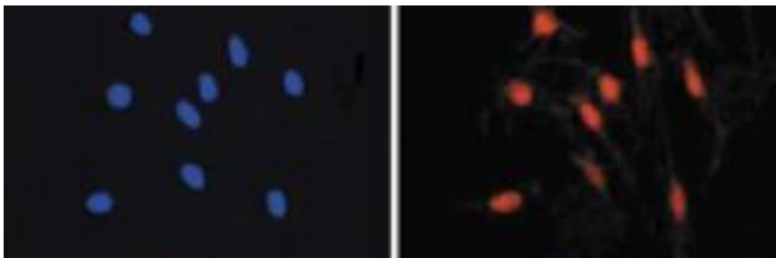
図 2. Melanocyte (メラニン形成細胞) の免疫蛍光染色。